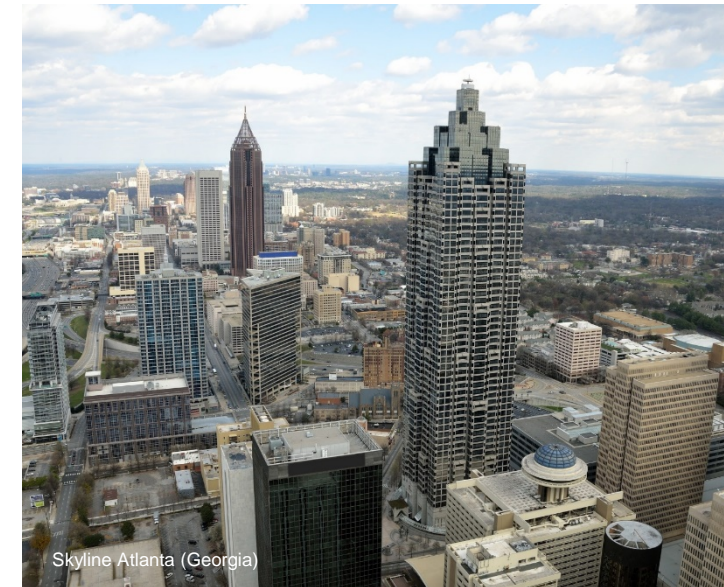
Skyline Atlanta (Georgia)

Georgia World Congress Center - Atlanta, GA